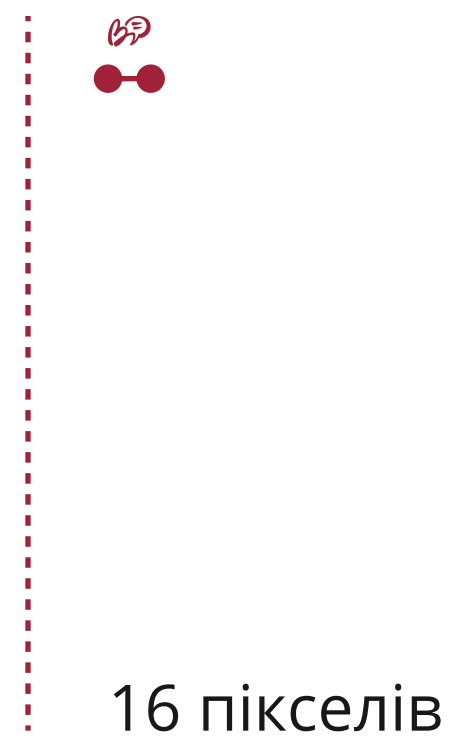
Мінімальний розмір логотипа